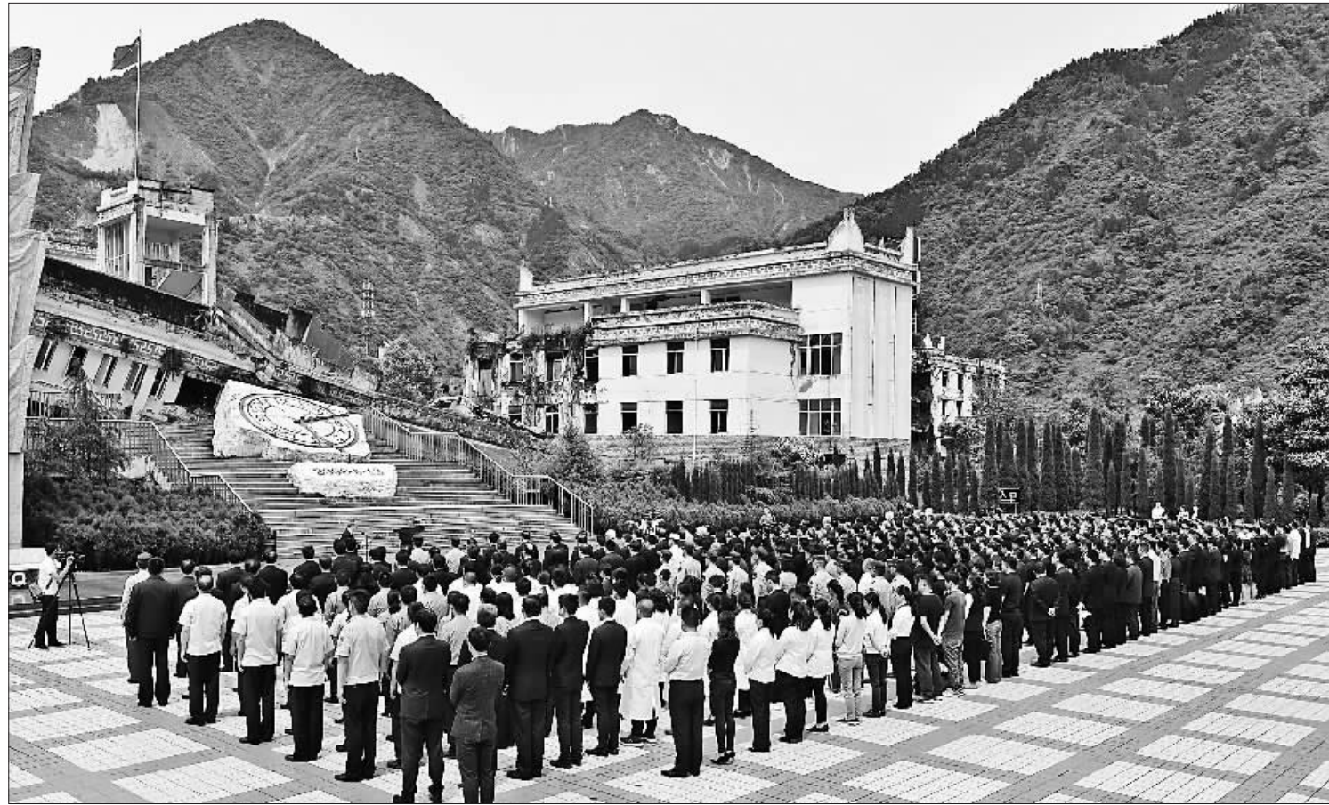
“5·12”汶川特大地震抗震救灾十周年纪念仪式现场。

在震中汶川映秀镇,漩口中学废墟遗址被原样保留,成为汶川特大地震的永久记忆。在倾倒的教学楼前,一个破碎表盘的雕塑永远定格在下午两点二十八分。在这一片以灰色为主色调的废墟中,一面鲜艳的五星红旗依然在高处迎风飘扬。遗址西侧,一面浮雕墙用铭文和雕塑记述着地震灾难造