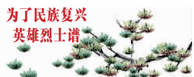
为了民族复兴 英雄烈士谱