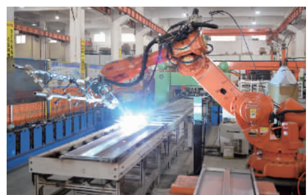
浙江精工科技大数据机柜全自动机器人焊接生产