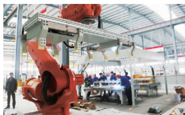
浙江梅轮立档机器人焊接工作站