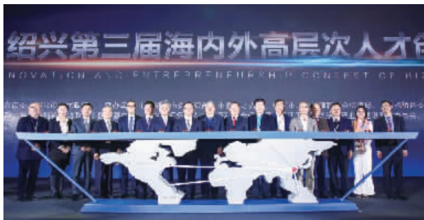
中国绍兴第三届海内外高层次人才创业大赛3月24日在北京启幕

RoboCup机器人世界杯中国赛是业内具有广泛影响力的权威机器人学术竞赛之一，是智能制造技术创新、交流和高端人才培养的重大品牌活动。该赛事从1999年开始，已先后在北京、重庆、上海、广州、苏州、常州、合肥、长沙、日照等地成功举办了19届。本届大赛共吸引来自全国25个省、自治区、直辖市，中国香港、澳门地区以及韩国的452所学校的555支代表队共2472名师生参加比赛，比赛项目包括：RoboCup足球类人组、中型组、仿真组、小型组、标准平台组，RoboCup救援组，RoboCup家庭组，RoboCup青少年足球、救援、舞蹈项目，以及RoboCup青少年标准平台、太空机器人、灵巧控制、工程创意、人形机器人微电影、少儿创意等。本次大赛的举办，将有力促进学科交叉