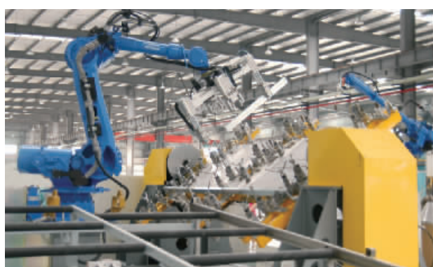
轻钢装配式结构体系多层工业化住宅生产线