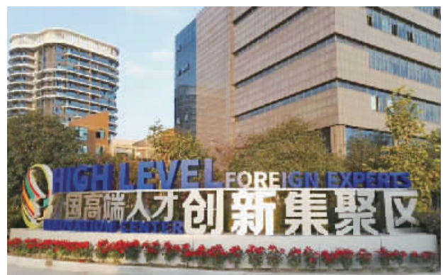
浙江(绍兴)外国高层次人才创新集聚区

在此背景下，4月12-15日，中国自动化学会在绍兴柯桥举办“2018国家机器人发展论坛暨RoboCup机器人世界杯中国赛”。由机器人及自动化产业界、学术界以及创投界的代表，全方位展示机器人及人工智能产业发展的前沿成果，深入思考机器人产业的发展现状及未来发展趋势。