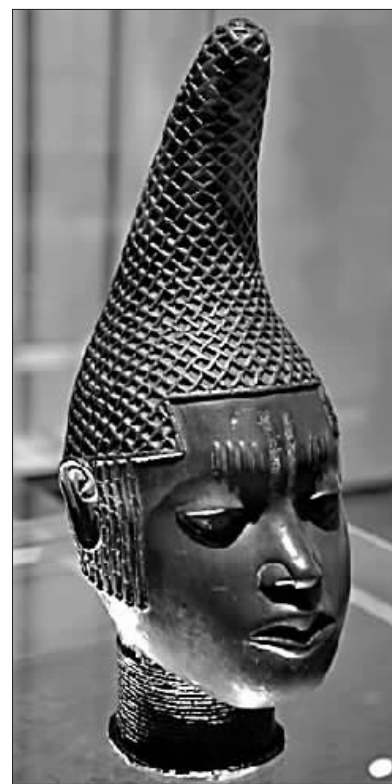
贝宁文化著名的《贝宁母后头像》