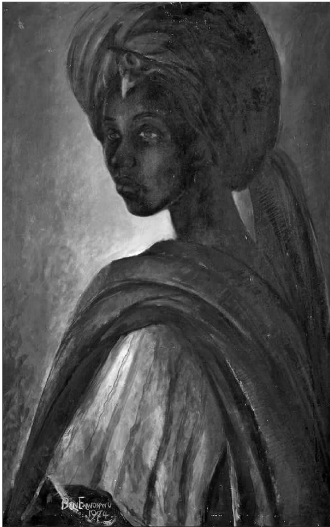
《图图》画像,被称作“非洲版蒙娜丽莎” 均为资料图片

现代伊费城的最高首领仍被称为奥尼,奥甲伽二世(Oja-ga II)是时任第51任奥尼,于2015年继任。事实上,伊费古国虽已逝,王权今犹在。现在伊费城市的居民仍称呼奥尼为“国王陛下”。1986年约鲁巴·奥里沙国会(Yoruba Orisha Congress)成立,奥尼的王权正式被认可。此后,奥尼一直被尊为伊费“圣城”的首席牧师和所有约鲁巴人的监护人,不仅仅在约鲁巴人中受到敬仰,而且在整个尼日利亚也享有尊贵的地位。在某种程度上,奥尼的功能随着时代而改变,如在1903年,当时尼日利亚是英国殖民地,第46任奥尼阿德勒坎·奥卢布斯一世(Adelekan Olu-buse I)受拉各斯殖民地总督沃尔特·埃德加(Walter Egerton)邀请去解决争端。由于要前往拉各斯殖民地,所以他成为第一个离开伊费城的奥尼。在奥尼离开伊费期间,所有其他约鲁巴城邦王都离开了各自的宝座,以示对他的尊重,当奥尼从拉各斯返回伊费时,他们才回到自己的宝座上。