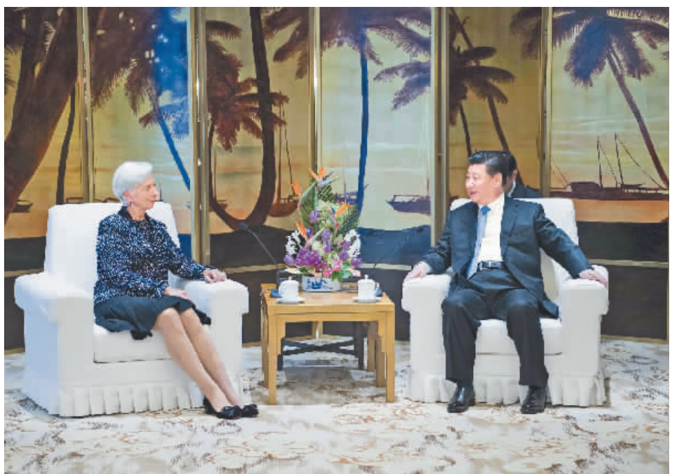
4月10日,国家主席习近平在海南省博鳌国宾馆会见国际货币基金组织总裁拉加德。