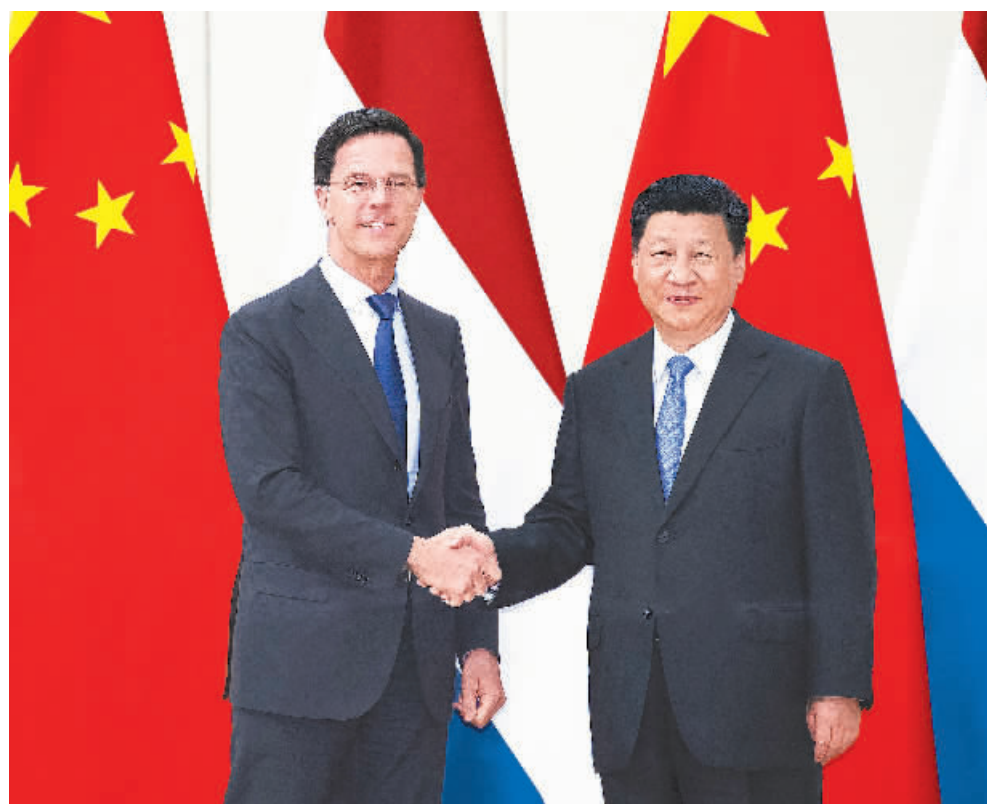
4月10日,国家主席习近平在海南省博鳌国宾馆会见荷兰首相吕特。