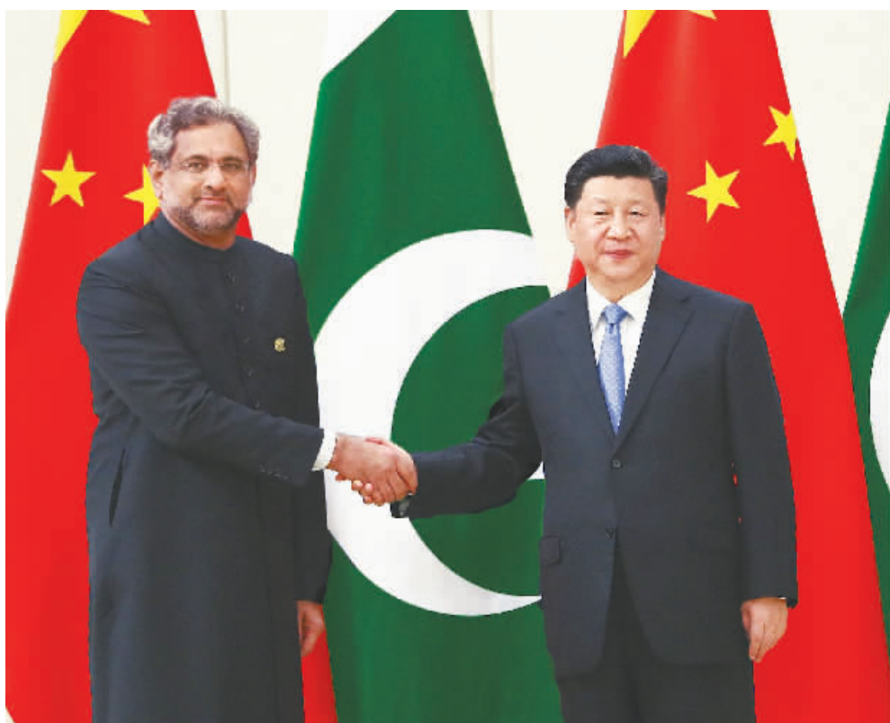
4月10日,国家主席习近平在海南省博鳌国宾馆会见巴基斯坦总理阿巴西。