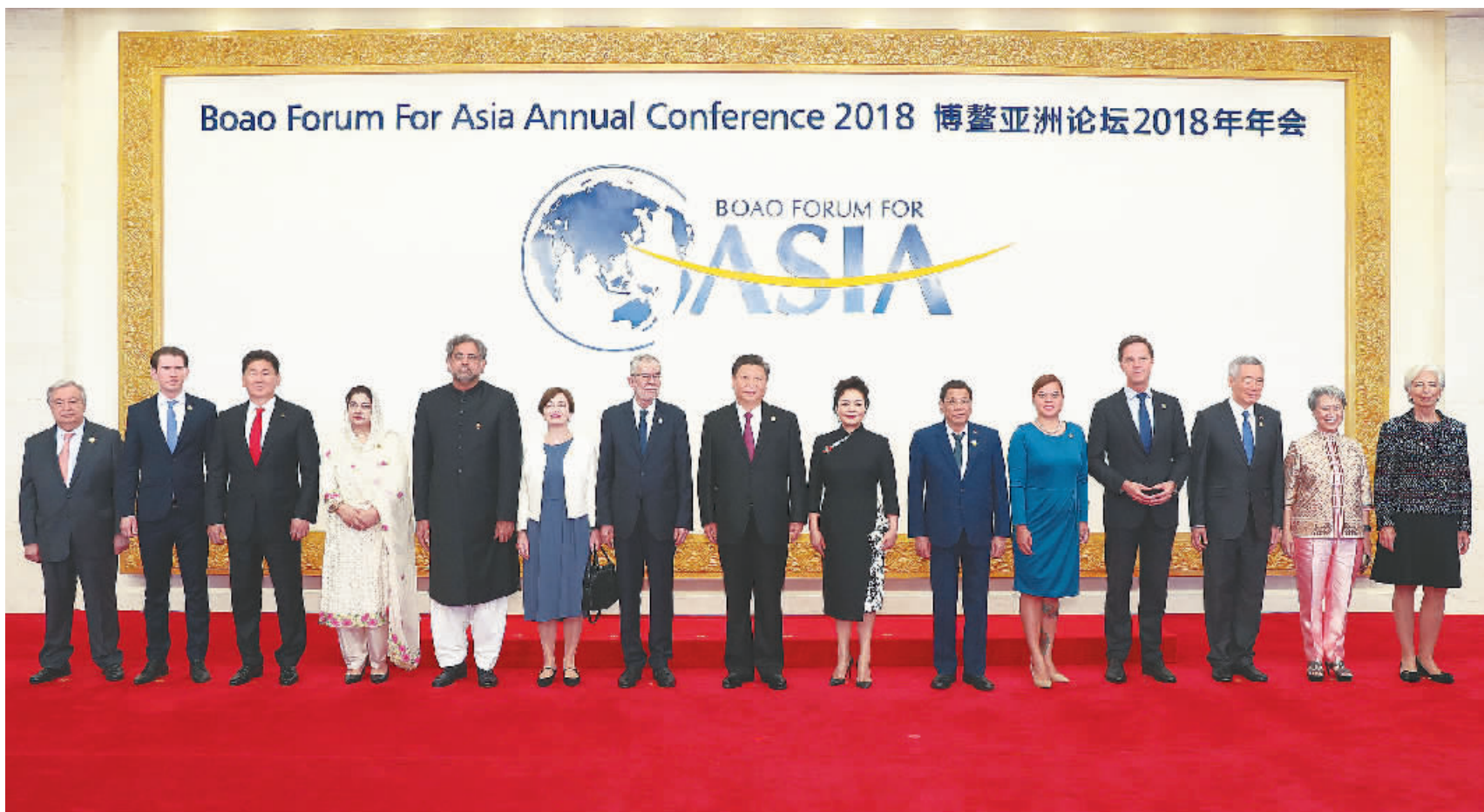
4月10日,博鳌亚洲论坛2018年年会在海南省博鳌开幕。国家主席习近平出席开幕式并发表题为《开放共创繁荣 创新引领未来》的主旨演讲。开幕式前,习近平和夫人彭丽媛在迎宾厅迎接外方领导人夫妇并集体合影。

新华社海南博鳌4月10日电(记者刘华、周慧敏、刘红霞)10日上午,博鳌亚洲论坛2018年年会在海南省博鳌开幕。国家主席习近平出席开幕式并发表题为《开放共创繁荣 创新引领未来》的主旨演讲,强调各国要顺应时代潮流,坚持开放共赢,勇于变革创新,向着构建人类命运共同体的目标不断迈进;中国将坚持改革开放不动摇,继续推出扩大开放新的重大举措,同亚洲和世界一道,共创新时代和世界的未来。