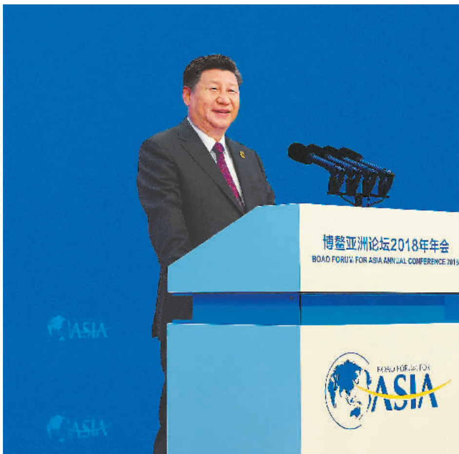
4月10日,博鳌亚洲论坛2018年年会在海南省博鳌开幕。国家主席习近平出席开幕式并发表题为《开放共创繁荣 创新引领未来》的主旨演讲。