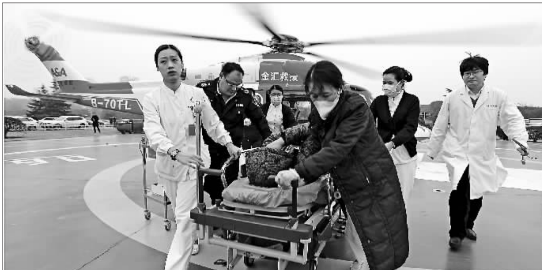
上海市民突发胸痛，医院出动直升机紧急救援。