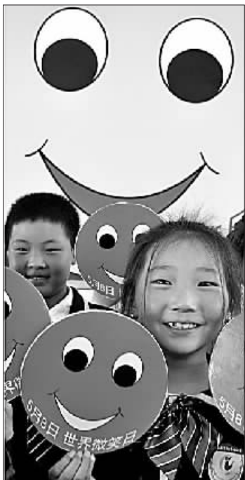
湖北襄阳小学生展示自己绘制的卡片。