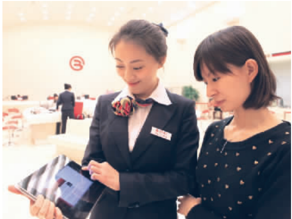
北京银行工作人员通过现代化移动终端为客户提供便捷的金融服务。

检验一家银行质量管理水平最重要的是资产质量和风险防控能力。成立22年来，北京银行始终坚持稳健经营原则，坚决贯彻各项监管政策，将提升资产质量和防控金