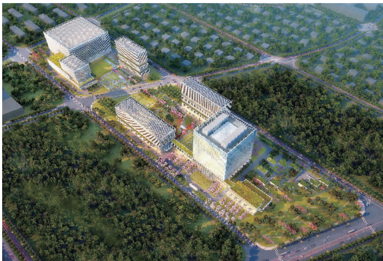
位于北京顺义的北京银行科技研发中心，将满足该行未来50年科技系统发展需求。

融风险作为永恒主题。成立初期，北京银行完全依靠自身发展创造的税后利润，化解了成立之初发生额高达229亿元、实际损失额高达67亿元的历史遗留的不良资产，建立了扎实的监督管理体系。新形势下，北京银行进一步强化风险管理，成立全面风险管理领导小组，构建风险偏好指标体系，完善监测预警机制，严格全口径业务授信审批管理和全资产授信后风险管理，提升风险主动防控能力；深入开展“三三四十”专项排查治理以及“两个加强、两个遏制”回头看整改问责工作，对问题责任单位和责任人进行严肃问责，提升各级人员合规风险防控意识。北京银行在2017年末圆满完成206亿元非公开发行项目，提升核心一级资本充足率1.17个百分点，为高质量、可持续稳健发展奠定了坚实的资本根基。