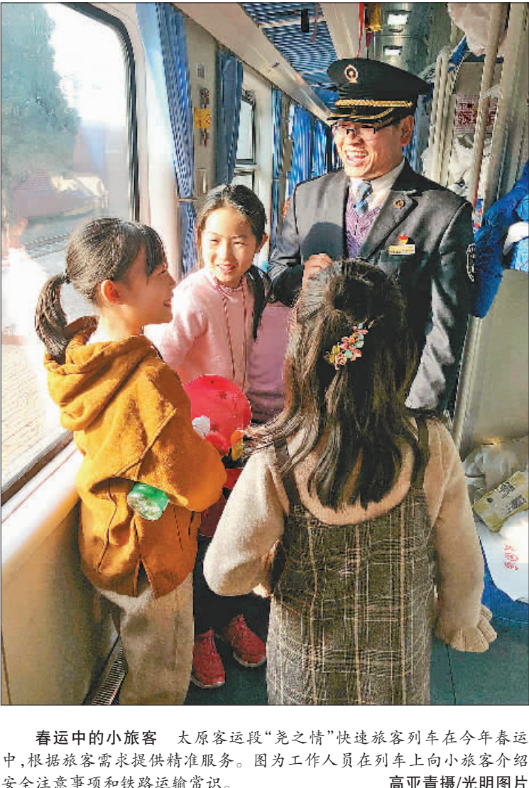
春运中的小旅客 太原客运段“免之情”快速旅客列车在今年春运中,根据旅客需求提供精准服务。图为工作人员在列车上向小旅客介绍安全注意事项和铁路运输常识。

“我希望从方法论的角度,为大家提供更多思考和选择的方法。”徐川说,“只有激发大家更加自觉地学习、思考、实践,才能让党的十九大精神更好地落地生根。”