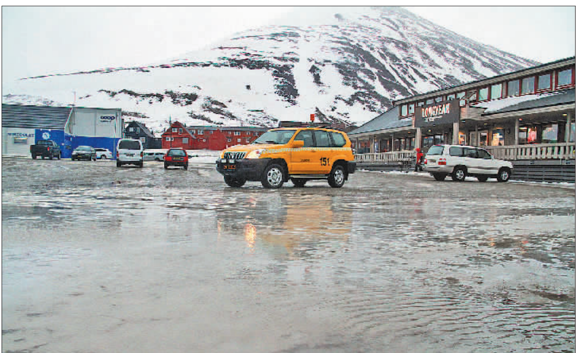
朗伊尔城位于挪威属地斯瓦尔巴群岛的最大岛——斯匹次卑尔根岛，地处北纬78度，距离北极点只有1300公里。然而，在这个号称全球最北的小镇，2月26日当天的白天气温却高达零下4摄氏度，夜间也未突破冰点。在正常情况下，该城2月的平均气温为零下18摄氏度左右。

从2月下旬开始，朗伊尔城刚刚结束了长达4个月极夜时间。这个长住登记人口约2100人的小城，坐落于雪山包围的一个狭长山谷