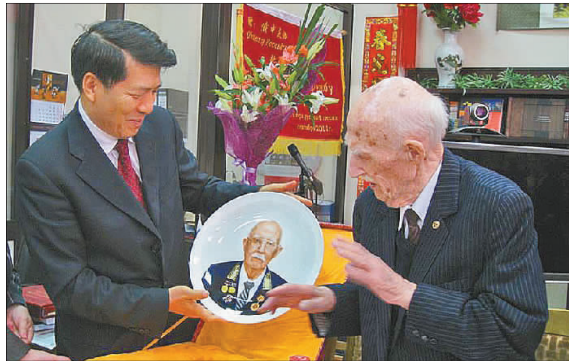
2013年9月2日，我驻俄大使李辉向齐赫文斯基院士赠送烧制其头像的瓷盘作为其95岁生日贺礼。资料照片

齐赫文斯基也是资深外交家，是苏中、俄中关系和新中国发展的见证者。他作为苏联高级外交官参与了苏联承认新中国政权的全部过程，并参加了开国大典。1981年后，他任苏中友好协会主席、荣誉主席。他曾多次作为外交官来华工作，目睹或参与了在中国许多重大历史事件。他一生不遗余力研究和传播中国历史和文化，致力于发展苏中（俄中）友好关系，并作出了杰出贡献。