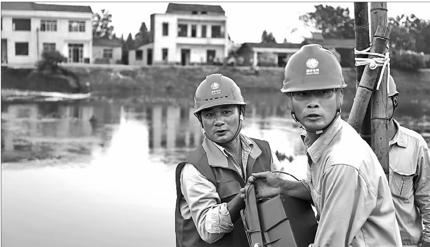
在2016年华容新华垸溃堤抢险中，“电骆驼”上演“生死救援”。

诗歌表达的是这家电力企业的“骆驼精神”，抒发的“是做时代骆驼，当光明使者”的情怀。