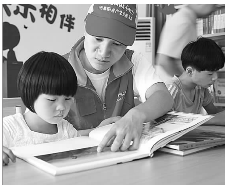
“电骆驼”爱心图书室，为山区儿童点亮“心灯”。