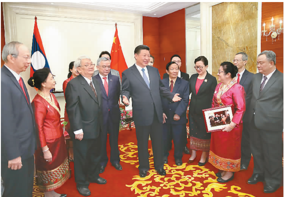
11月14日,中共中央总书记、国家主席习近平在万象下榻饭店会见老挝奔舍那家族友人。

习近平特别叮嘱奔舍那家族的下一代年轻人,强调青年人不仅是两国社会主义事业的希望,也是中老友好事业的