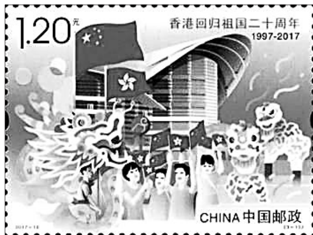
香港回归纪念邮票