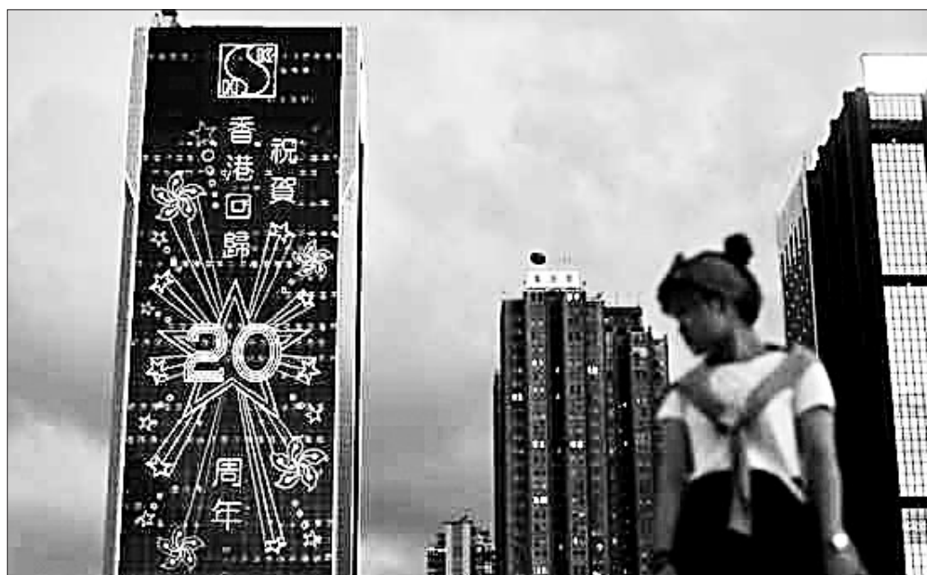
香港维多利亚港周边建筑上打出庆祝香港回归祖国20周年标语。

二是本书客观总结了“一国两制”在香港举世公认的成功实践,指出其成功表现在六大方面:宪法和基本法赋予中央的职责得到了