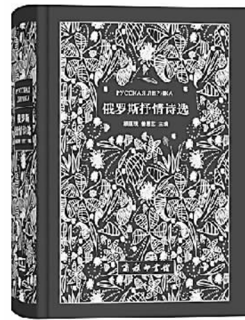
《俄罗斯抒情诗选》 顾蕴璞 曾思艺 主编 商务印书馆