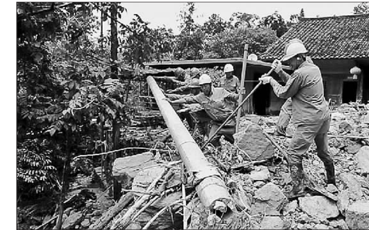
抢险 近日,湖北省五峰县普降大暴雨,导致山洪暴发、河水猛涨,造成当地24000多人受灾。目前,降雨暂停,抢险工作紧张进行。图为供电员工在采花乡栗子坪对受损的供电线路进行抢修。