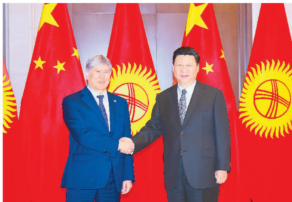
5月16日,国家主席习近平在北京钓鱼台国宾馆会见来华出席“一带一路”国际合作高峰论坛的吉尔吉斯斯坦总统阿坦巴耶夫。

新华社北京5月16日电(记者白洁)国家主席习近平16日在钓鱼台国宾馆会见来华出席“一带一路”国际合作高峰论坛的吉尔吉斯斯坦总统阿坦巴耶夫。