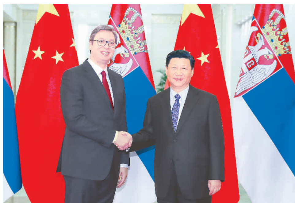
5月16日,国家主席习近平在北京人民大会堂会见来华出席“一带一路”国际合作高峰论坛的塞尔维亚总理、当选总统武契奇。

新华社北京5月16日电(记者郝亚琳)国家主席习近平16日在人民大会堂会见来华出席“一带一路”国际合作高峰论坛的塞尔维亚总理、当选总统武契奇。