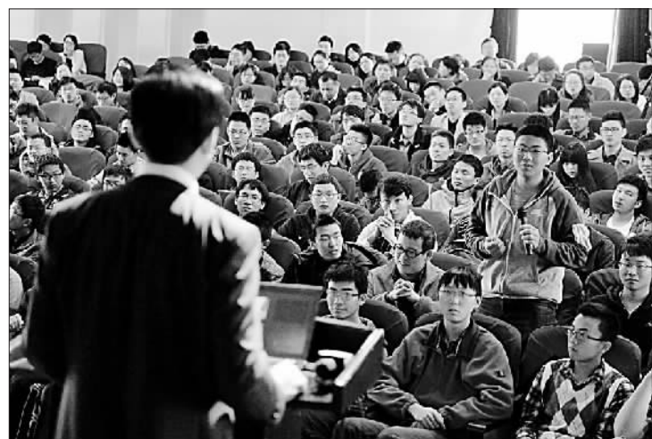
生动的大学思政课堂。

学院也注重协同政府、行业、企业共同参与文化育人,形成“政校行企联动、产教融合”的新机制。正因为此,学院蝉联“全国文明单位”,荣获“全国创新创业教育的文化渗透,实现专业教育与文化素质教育有机贯通。三要融入师资队伍队伍建设。把培育和践行社会主义核心价值观与师德师风建设相结合,提高教师队伍的思想政治素质,实现教书与育人相结合、言传与身教相结合。四要融入校园生活。培育校园文化品牌活动,提升校园文化活动的育人效果。五要融入社会实践。通过社会实践,增强大学生的生活体验和感悟,提升道德情操和精神境界。