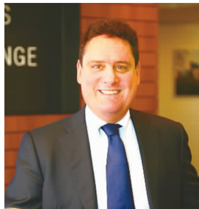
中欧数字协会主席鲁乙己。

鲁乙己说,今天的关键词是“合作”而不是“对抗”。对话与合作是处理国际事务与矛盾的唯一正确途径。历史的经验证明,对话与合作才能减少和消除误解和偏见。欧盟与中国历史、文化、宗教乃至生活习俗迥然不同,因此,与中国打交道需要耐心细致的接