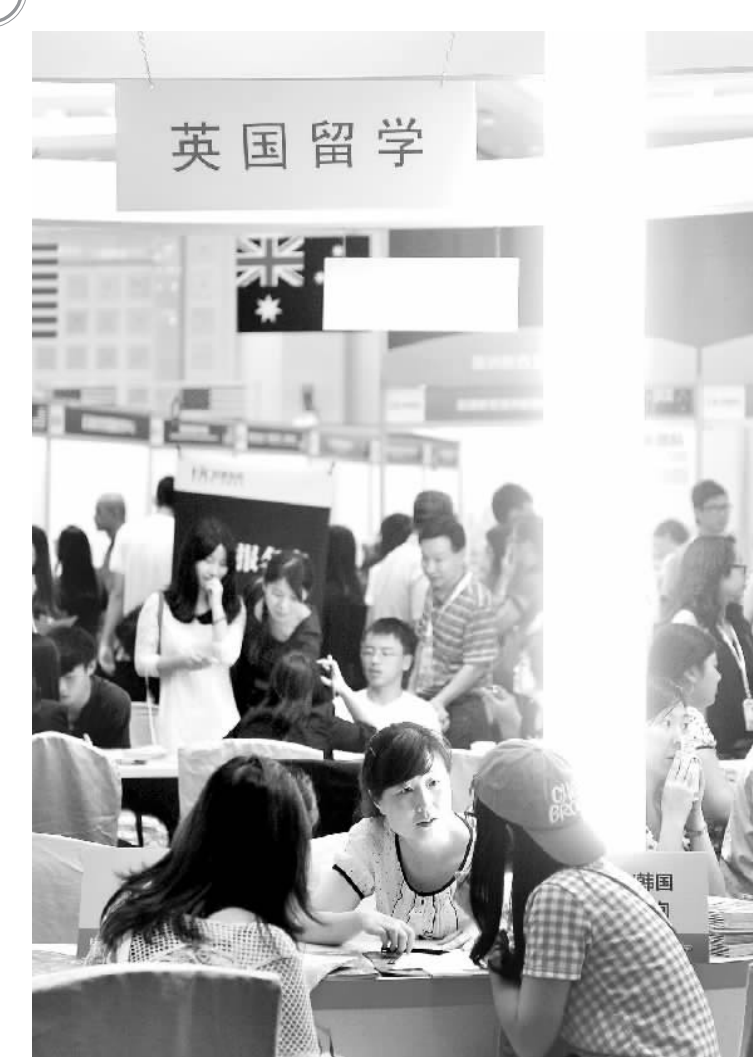
▲在广州市举行的一个国际教育展暨出国考试展上,参展人员向学生和家提供前往英国留学的有关咨询服务。

STEM 简单来说有些类似于国内“理工科”的概念,是四大类学科,Science(科学),Technology(技术),Engineering(工程学)和Math(数学)的统称,包含了非常多的专业,留美中国学生就读专业Top10中的工程学、数学/计算机科学、物理/生命科学以及健康专业均属于STEM(完整的专业列表可在美国移民和海关执法局网站www.ice.gov上查看)。美国有成熟的IT、化工产业,这两个领域的学生有非常多且优质的工作机会,而数学、物理等学科的学生毕业后进入金融、保