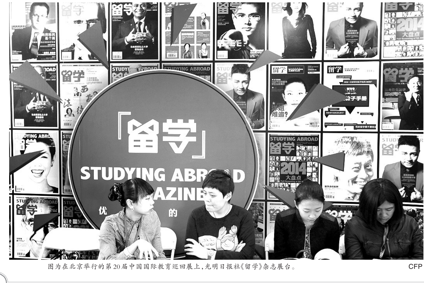
图为在北京举行的第20届中国国际教育巡回展上,光明日报社《留學》杂志展台。