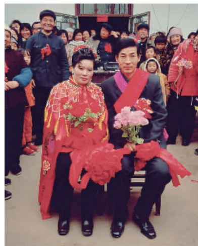
河南尉氏县,2000年(摄影)姜健