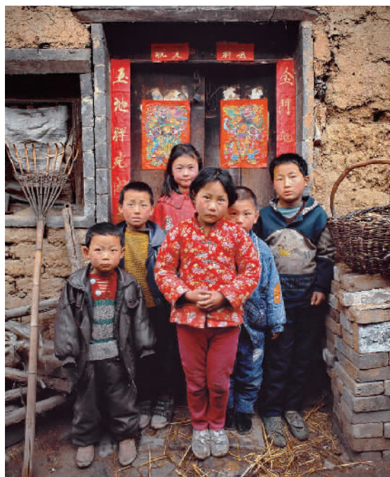
河南登封市,1997年