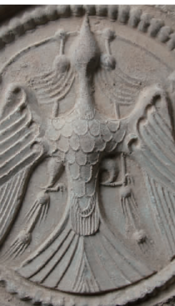
“天人合一之金乌神鸟”瓦当(局部)