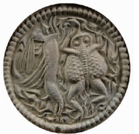
“天人合一之玉兔蟾蜍”瓦当