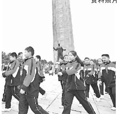
2015年9月30日——南京军界、江苏省各界向雨花台烈士纪念碑敬献花篮。 资料照片

人民群众根本利益的高尚道德情操。为更好地发挥雨花英烈精神的现实功能,一是要有高端的理念,要建立我们自己的精神殿堂。弘扬雨花英烈精神,用好用活丰富的党史资源,新的时代给我们提供了新的契机,必须要放眼世界,面向全国,设计和建设好雨花英烈精神的物质载体。二是打造构建弘扬雨花英烈精神的广阔平台。南京具有丰富的红色文化资源,要进一步整合这些文化机构和管理机构,便于利用好各种资源,建设传播红色文化的重要基地。