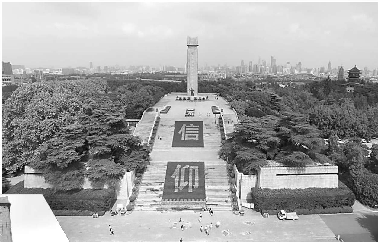
2015年10月雨花台革命烈士纪念碑“信仰”航拍。 资料照片

要深刻认识雨花英烈精神,就需要准确把握这一精神的科学内涵,具体来讲就是要有坚定信仰的理想主义精神、敢于斗争的斗争主义精神、不惧牺牲的乐观主义精神、甘于奉献的共产主义精神,这四个方面的互为依存的精神共同体。雨花英烈精神代表着人间正道、人间正气、人间正义,是我们今天进行党史、国史教育的重要精神文化资源。要让国人,特别是我们年轻一代的共产党员,从内心深处敬仰那些为新中国、为共产主义事业英勇献身的先烈们,敬仰雨花英烈无限忠诚于马克思主义、无限忠诚于党的崇高事业、无限忠诚于广大