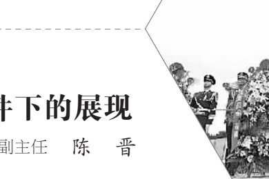
2015年9月30日——南京军界、江苏省各界向雨花台烈士纪念碑敬献花篮。 资料照片

为深入贯彻落实习近平总书记的重要讲话精神,中宣部宣教局、光明日报社、南京市委、江苏省委宣传部、江苏省委党史工办近日在南京召开了雨花英烈精神研讨会,围绕雨花英烈精神的重要意义、时代价值和实践要求等主题进行深入研讨,形成了许多新理念新观点。