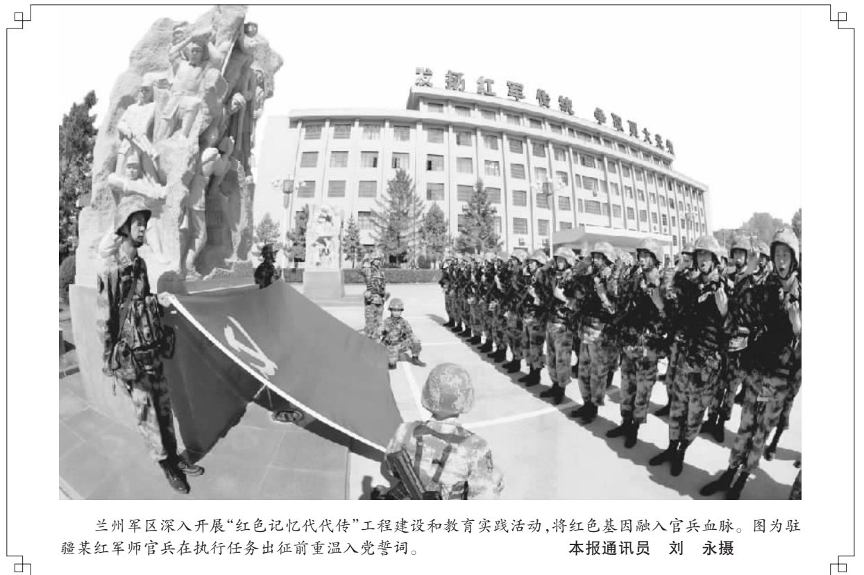
兰州军区深入开展“红色记忆代传”工程建设和教育实践活动,将红色基因融入官兵血脉。图为驻隰县红军师官兵在执行任务出征前重温入党誓词。