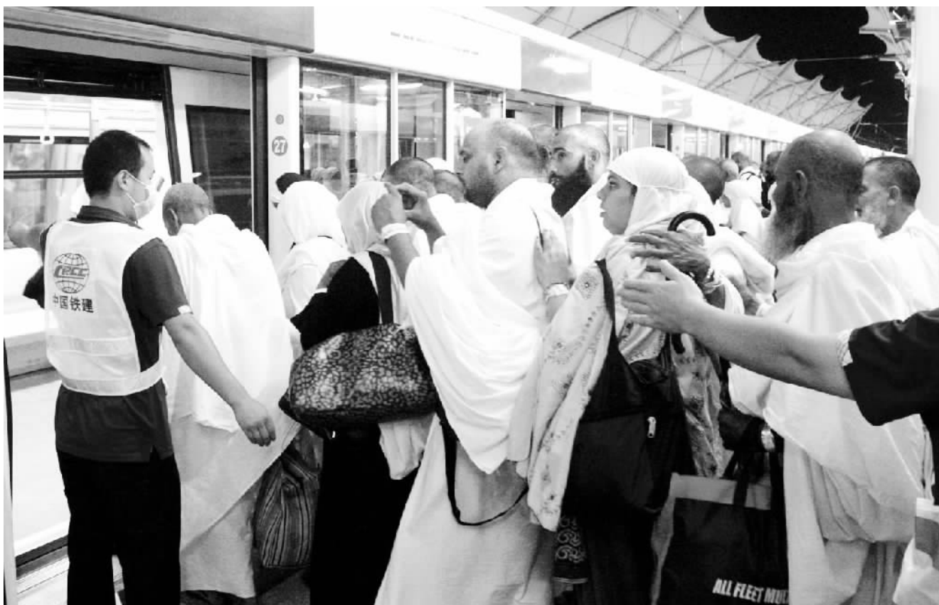
中国铁建启动2013年麦加朝觐轻轨运营 10月14日,在沙特阿拉伯麦加的米纳站,朝觐的穆斯林排队等候乘车。由中国铁建股份有限公司(中国铁建)承建的沙特阿拉伯轻轨铁路13日迎来在沙特阿拉伯伊斯兰教圣城麦加朝觐者,这是中国铁建连续第4年为各国朝觐者提供交通运输服务。今年,麦加轻轨铁路预计在5天时间里完成约250万人次的运营任务。

强与东南亚国家的务实合作,言惠且实至,受到东南亚国家热烈欢迎。中国的周边外交环境正在发生微妙变化。中越关系不进则退。中越均处在经济社会发展的关键时期,既面临难得的发展机遇,也存在不少复杂因素和挑战。中越关系在量上取得了长足进步,但要实现质的突破,还需双方共同努力,把海上局势稳定下来,为两国友好交往和务实合作创造稳定的双边关系预期。引领中越关系的发展要用新思路,要把握方向,也要相向而行。我们期待,李克强总理此次越南之行将成为增进双方政治互信、深化互利合作的重要契机。