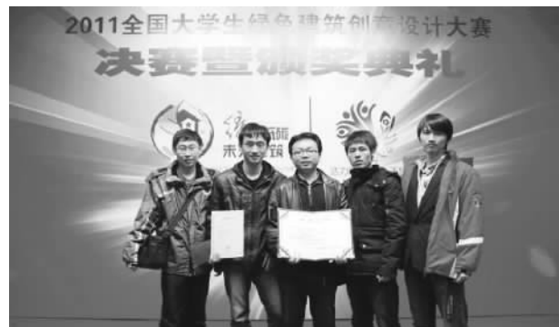
文华学院学生参加全国大学生绿色建筑创意设计大赛荣获“十佳”殊荣

学校经过讨论认为,学校应充分尊重学生的意愿,给予学生自主选择专业的权利。为此,学校支持、引导学生根据自己的爱好、兴趣、需求选择专业,允许学生同批次转专业,甚至文理科专业也可以互转。从新生入学报到之时的专业调整,直到大学二年级,学生可以有3次转专业的机会。