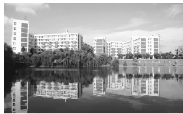
阳光沐浴下的文华学院学生宿舍

努力追求让每个学生都可以找到自由发展的空间,文华学院在探索个性化教育的道路上任重道远。