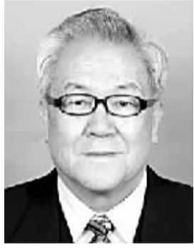
张显清 男,1937年3月出生,河北兴隆人。学术专长为中国古代史、明史。代表作《明代后期社会转型研究》《严嵩传》《张显清文集》等。