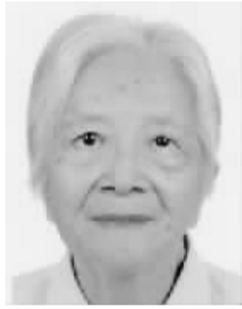
黄湘湘 女,1915年5月出生,湖南临澧人。学术专长为美国史、中国美国史研究奠基人之一。代表作《美国简史》、《美国早期发展史》《美国通史简编》《美国史纲》等。