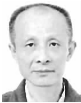
余太山 男,1945年7月出生,江苏无锡人。学术专长为中外关系史。代表作《塞种史研究》《古族新考》《两汉魏晋南北朝正史西域传研究》等。