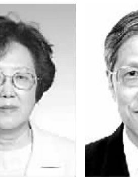
资中筠 女,1930年6月出生,湖南耒阳人。学术专长为国际政治、美国研究。代表作《古史》、《中美关系、美国外交》。代表作《美国政府和美国政治》等。