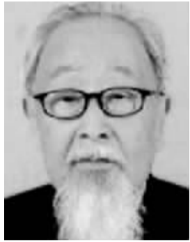
李瑚 男,1926年5月出生,辽宁锦州人。学术专长为中国近代史及经济史。代表作《中国通史》第五册、《中国经济史从稿》《魏源研究》《晚学集》等。