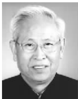
吕一燃 男,1929年1月出生,福建南安人。学术专长为中国边疆史。代表作《中国近代边界史》(上下卷)、《沙俄侵华史》(1-4卷)、《中国北部边疆史研究》《南海诸岛:地理·历史·主权》等。