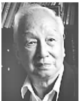
王庆成 男,1928年4月出生,浙江嵊县人。学术专长为太平天国史、晚清史。代表作《石达开》《太平天国的历史和思想》《太平天国的文献和历史》《稀见清史史料并考释》等。