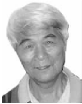
庞朴 男,1928年10月出生,江苏淮阴人。学术专长为中国古代思想史、文化史。代表作《公孙龙子研究》《帛书五行篇研究》《沉思集》等。