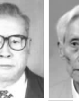
李琮 男,1928年1月出生,河北丰润人。学术专长为世界经济。代表作《第三世界论》《当代资本主义新发展》《当代国际垄断——巨型跨国公司综论》等。