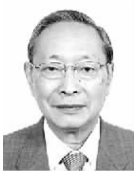
杨天石 男,1936年2月出生,江苏东台人。学术专长为中国文化史、中国近代史。代表作《中华民国史》《中国通史》第12册《杨天石近代史文存》(5卷本)《揭开民国史的真相》等。