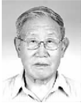
张振 男,1926年5月出生,河北正定人。学术专长为近代中外关系史。代表作《帝国主义侵华史》(第一、二卷)《日本侵华七十年史》等。