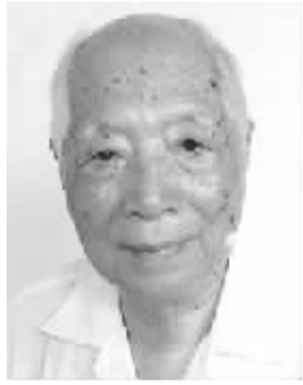
瞿同祖 男,1910年7月出生,湖南长沙人。学术专长为中国社会史、中国法律史。代表作《中国封建社会》《中国法律与中国社会》《中国法律之儒家化》等。