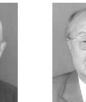
高恒 男,1930年1月出生,湖北老河口人。学术专长为中国法制史、中国法律思想史。代表作《秦汉法律论考》、《秦汉简牍中法制文书考》、《论中国古代法学与法学的关系》等。