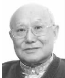
梁存秀 别名梁志学,男,1931年6月出生,山西定襄人。学术专长为德国古典哲学。代表作《论黑格尔的自然哲学》、《费希特青年时期的哲学创作》等。