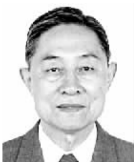
王松霁 男,1928年8月出生,天津人。学术专长为生态经济、农村经济。代表作《生态经济学》、《走向21世纪的生态经济管理》等。