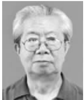
何维 男,1930年12月出生,吉林吉林人。学术专长为生态经济、林业经济。代表作《农业生态经济学》、《论长江有变成第二黄河的危险》等。