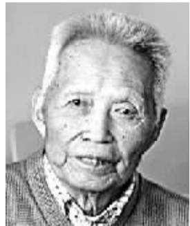
汪敬虞 男,1917年7月出生,湖北蕲春人。学术专长为中国近代经济史。代表作《十九世纪西方资本主义对中国的经济侵略》等。