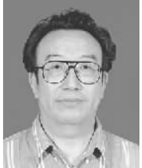
高莽 男,1926年10月出生,黑龙江哈尔滨人。学术专长为俄苏文学研究、翻译和编辑工作。代表作《圣山行》、《高贵的苦难》、《墓碑·天堂》等。