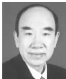
李步云 男,1933年8月出生,湖南娄底人。学术专长为法学理论、宪法学、人权理论。代表作《论法治》、《论人权》、《我的治学为人》、《走向法治》等。