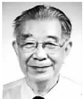
于光远 男,1915年7月出生,上海人。学术专长为经济学、哲学。代表作《政治经济学社会主义部分探索》、《中国社会主义初级阶段的经济》等。