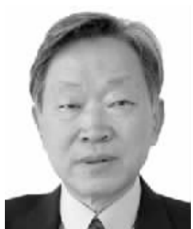
刘海年 男,1936年4月出生,河南唐河人。学术专长为中国法律史、法治与人权理论。代表作《刘海年文集》、《战国秦代法制管窥》、《睡虎地秦墓竹简》等。