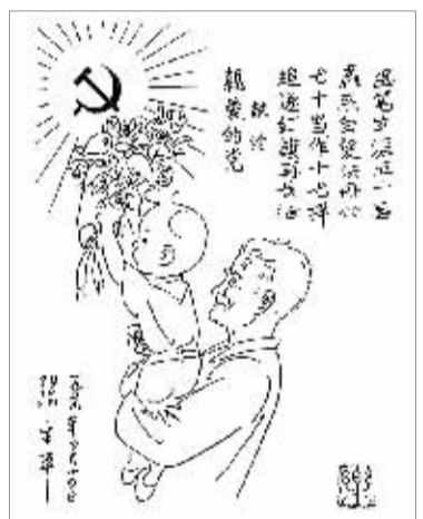
献给亲爱的党(漫画)张乐平

1953年1月《华东画报》出完了最后一期,我和部分同志调到了北京人民美术出版社。到北京后我和乐平同志等上海老战友一直保持联系,不断得到“娘家人”的支持。张乐平对我们帮助最大的有两件事:一是《三毛流浪记》在上世纪80年代的出版,二是《张乐平连环漫画全集》在上世纪90年代问世。《张乐平连环漫画全集》是中国连环画出版社于1994年出版的。问世后,立即受到社会广泛的欢迎,多次