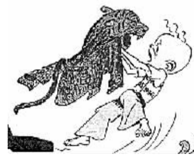
选自连环漫画《三毛流浪记》张乐平

排在畅销书排行榜前列。遗憾的是张乐平同志在1992年9月病逝,不能看到这番情景。