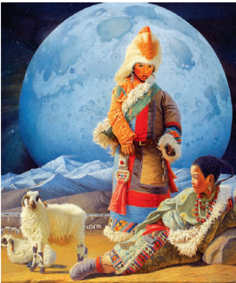
天上海藏(油画)张玉平