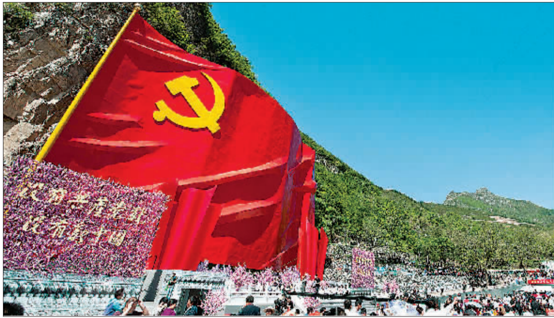
2011 年 5 月 22 日，“红歌唱响的地方”大型红歌主题演出在《没有共产党就没有新中国》歌曲诞生地——北京市房山区霞云岭乡堂上村的党旗广场上举行。来自总政歌舞团、空政歌舞团、战友交响乐团、天津少儿合唱团等演出团体的 800 多名演员通过独唱、合唱、联唱、拉歌等多种方式，演绎了多首深受人民群众喜爱的革命歌曲。