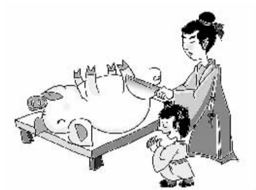
曾子杀彘 (漫画:杨震)

有一件小事,虽然过去十余年了,却在我和女儿的心中留下了不可磨灭的印象。十余年来,每当听到女儿提起那件小事,后悔、内疚的情感就会涌上我的心头,一次失信竟留下了永久的伤痛。 那年,我从新余市一中调到市金融系统,不久,家从城南迁居到城北,于是女儿入托也就由城南的一家幼儿园迁到了城北长青幼儿园。刚迁新园,人生地不熟,性格倔强的女儿说什么也不肯去长青幼儿园。每天早上,送女儿上幼儿园总是搞得我心情沉重。一天早上,我又在为送女儿上幼儿园发愁。女儿